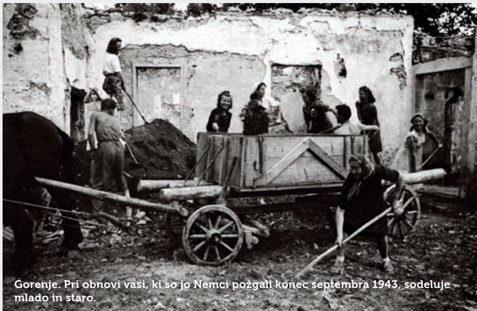
Gorenje. Pri obnovi vasi, ki so jo Nemci požgali konec septembra 1943, sodeluje mlado in staro.