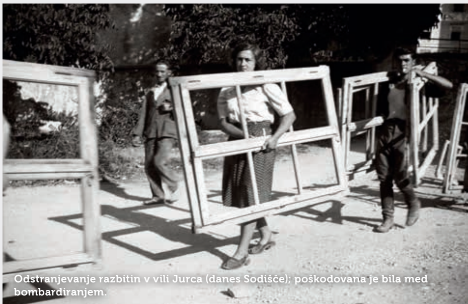
Odstranjevanje razbitin v vili Jurca (danes Sodišče); poškodovana je bila med bombardiranjem.