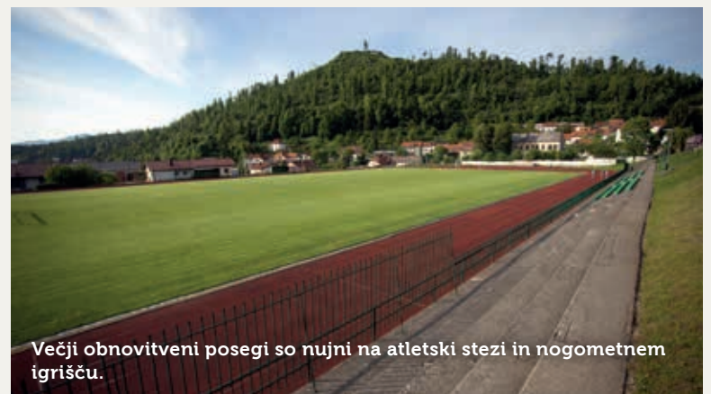
Večji obnovitveni posegi so nujni na atletske stezi in nogometnem igrišču.