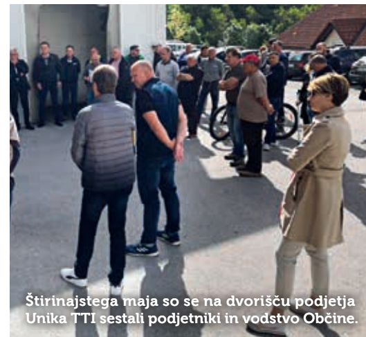
Štirinajstega maja so se na dvorišču podjetja Unika TTI sestali podjetniki in vodstvo Občine.

Na Občini poudarjajo, da gre za informativne izračune. Te so poslali naslovnikom na vpogled za morebitne popravke in pripombe, plačilo nadomestila pa bo po njihovem zagotovitvi zama- knjeno v drugo polovico leta 2020. Podjetjem, ki