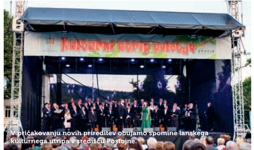
V pričakovanju novih prireditev obujamo spomine lanskega kulturnega utripa v središču Postojne.

S pripravo festivala so začeli že v januarju, zato so imeli do začetka epidemije program pripravljen skoraj v celoti. Festival naj bi potekal od 3. julija do 14. avgusta. Program je tudi za letošnje leto zastavljen za vse okuse – zajema od slovenskih večno zelenih popevk, jazza, popa, rocka, do narodno zabavne glasbe. Predvideli so tudi nastop dalmatinske klape, saj ti napevi vsako leto znova navdušijo domače občinstvo, in folklornih skupin, ter predstave in delavnice za otroke. Med izvajalci bodo Nina