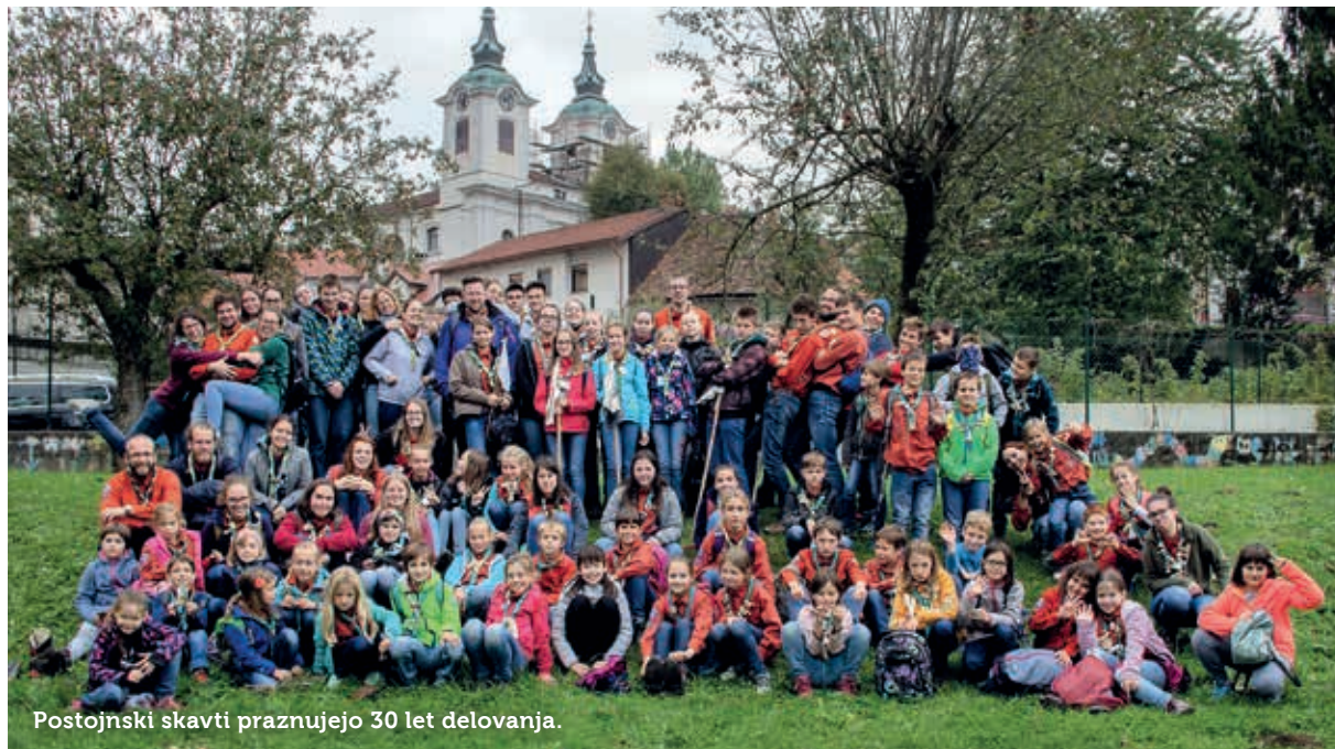
Postojnski skavti praznujejo 30 let delovanja.

Skavtski voditelji skrbno pripravijo članom med raznovrstnimi sreča-