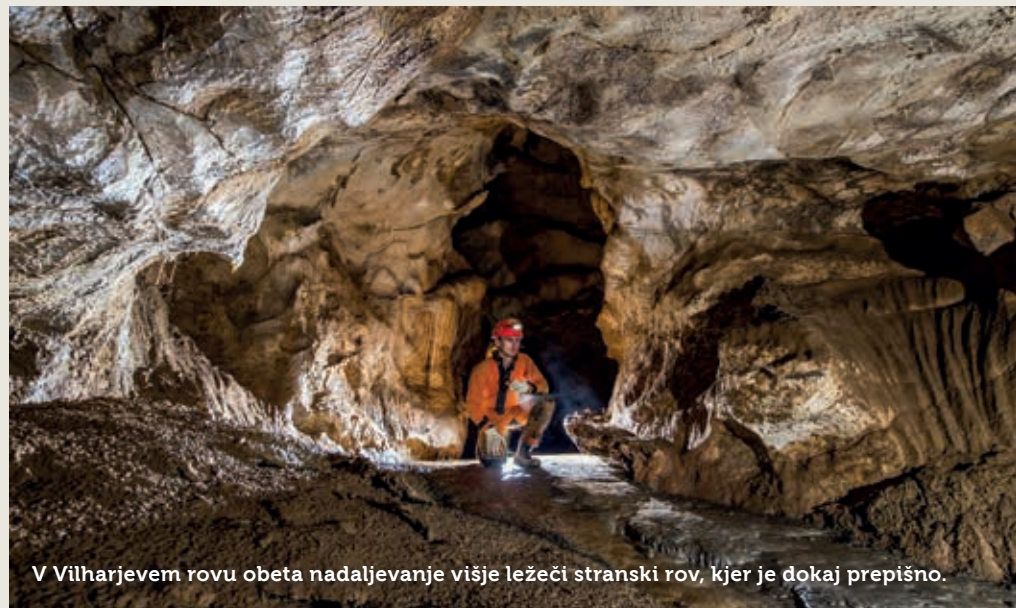
V Vilharjevem rovu obeta nadaljevanje višje ležeči stranski rov, kjer je dokaj prepišno.