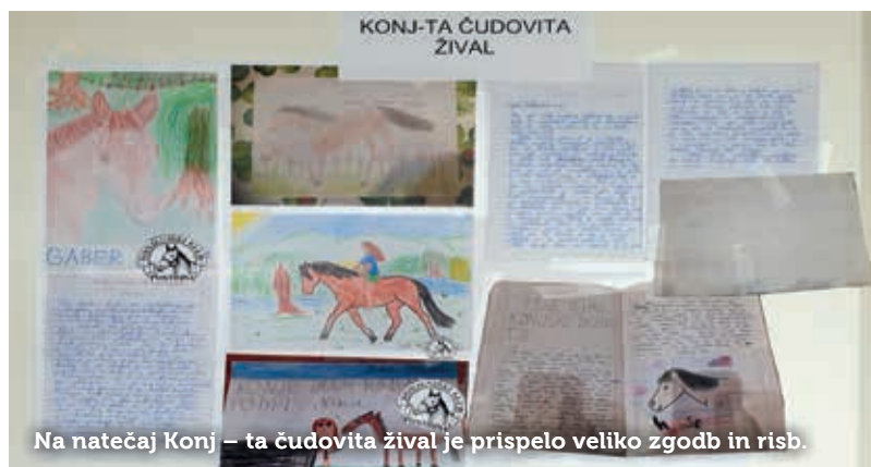
Na natečaj Konj – ta čudovita žival je prispelo veliko zgodb in risb.

Pripovedovanje zgodb je eden najbolj temeljnih načinov komuniciranja ter tudi zabavna in ustvarjalna igra. Otroci so lahko odlični pripovedovalci – mimogrede si izmislijo zgodbo, narišejo risbo. Prejeli smo kar nekaj zgodb – kratkih, daljših, domišljjskih in tudi resničnih, ter risb. Sodelujoči so se zelo potrudili, zato bodo tudi nagrajeni. Med počitnicami se bodo en cel dan družili s člani KK Postojna in spoznavali konjeništvu, delo s konji, delo v hlevu, predvsem pa bodo lahko jahali pod skrbnim in strokovnim