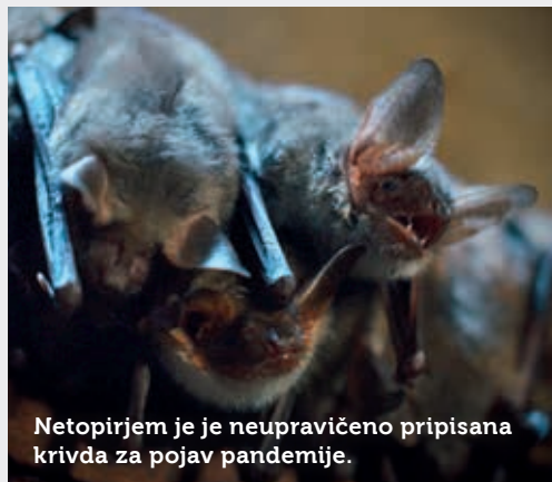
Netopirjem je neupravičeno pripisana krivda za pojav pandemije.

Koronavirusi gotovo obstajajo že tisoče let, vendar običajno niso nevarni za ljudi. Znani so pri mnogih vrstah tako domačih kot divjih živali.