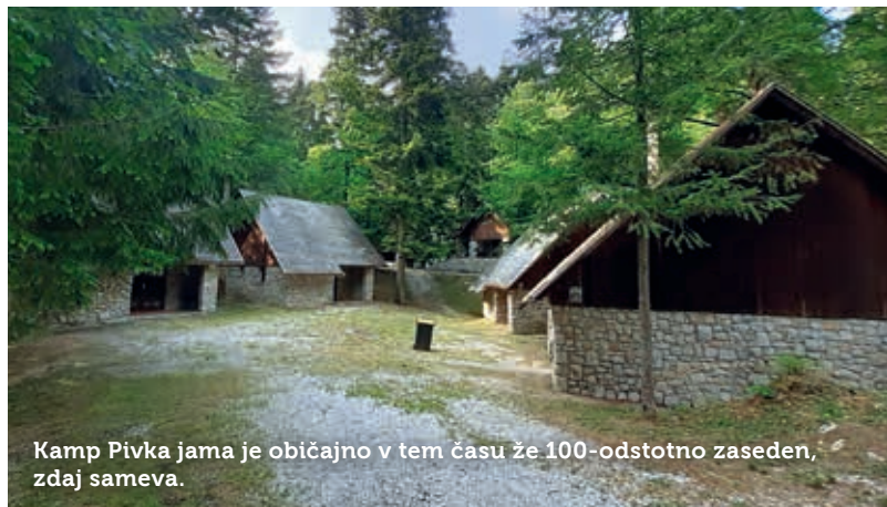
Kamp Pivka jama je običajno v tem času že 100-odstotno zaseden, zdaj sameva.

čja predelovalnih dejavnosti, sledijo trgovina, popravila in vzdrževanje motornih vozil, gradbeništvo in gostinstvo,« ugotavlja vodja urada.