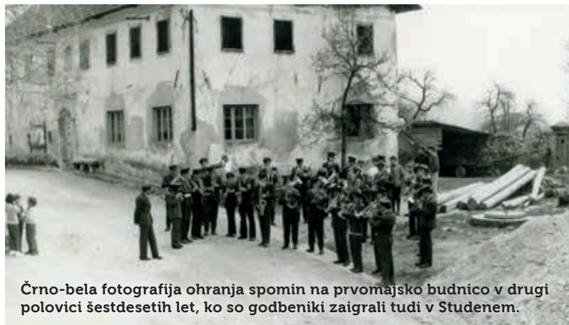
Črno-bela fotografija ohranja spomin na prvomajsko budnico v drugi polovici šestdesetih let, ko so godbeniki zaigrali tudi v Studenem.

Letos je bilo drugače. Medtem ko so se nekateri njihovi stanovski tovariši po Sloveniji pridružili akciji »Prebudimo Slovenijo 2020« in so drugi zaigrali kar na domačem oknu, balkonu ali dvorišču, spet tretjim pa so na pomoč priskočili gasilci in glasbo predvajali iz svojih gasilskih vozil, smo