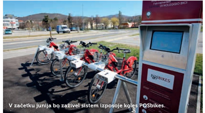
V začetku junija bo zaživel sistem izposoje koles POSbikes.