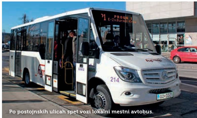
Po postojnskih ulicah spet vozi lokalni mestni avtobus.

Vse ambulante Zdravstvenega doma (ZD) Postojna zdaj že delujejo po skoraj običajnem urniku. Sredi maja so se odprle vse specia-