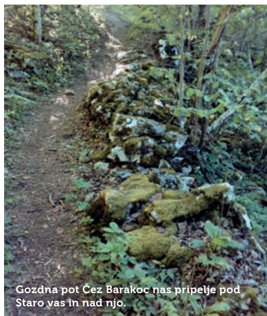
Gozdna pot Čez Barakoc nas pripelje pod Staro vas in nad njo.

jo uporabljali mnogi iz vseh bližnjih vasi, vse tja do Slavine. Prav ta drugi del makadamske ceste – ob robu letališke ravnine proti Rakitniku – je Občina Postojna pred nekaj leti lepo prenovila; še danes se je drži ime Stara cesta . Sredi 18. stoletja je bila to (po Terezijanskem katastru) glavna