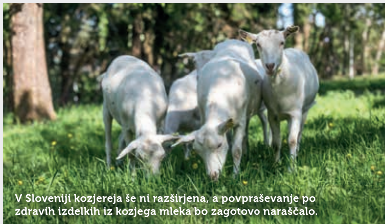
V Sloveniji kozjereja še ni razširjena, a povpraševanje po zdravih izdelkih iz kozjega mleka bo zagotovo naraščalo.

Besedilo: Jaka Zalar; fotografiji: Tomaž Penko.