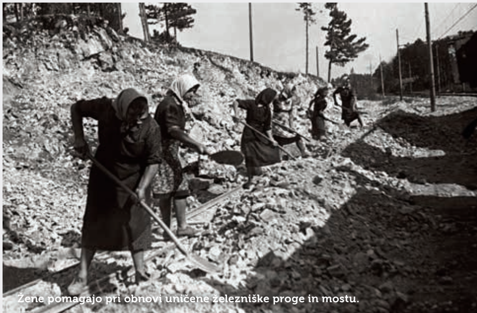
Žene pomagajo pri obnovi uničene železniške proge in mostu.

Besedilo: Alenka Čuk; fotografije: fototeka Notranjskega muzeja Postojna.