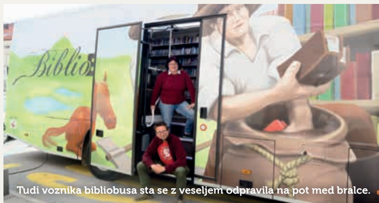
Tudi voznika bibliobusa sta se z veseljem odpravila na pot med bralce.

Knjižnica Bena Zupančiča Postojna je po poldrugem mesecu zaprtja skladno z vsemi varnostnimi ukrepi 4. maja spet odprla svoja vrata, potujoča knjižnica pa je krenila na pot dva tedna kasneje, 18. maja.