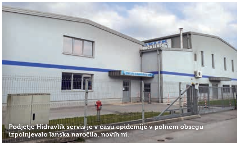
Podjetje Hidravlik servis je v času epidemije v polnem obsegu izpolnjevalo lanska naročila, novih ni.

ti, kaj bo prineslo leto. »Še vedno računamo na umiritev situacije in na prihajajočo sezono. Če ta ne bo uspešna, je scenarij lahko hujši, kot je bil leta 2008.«