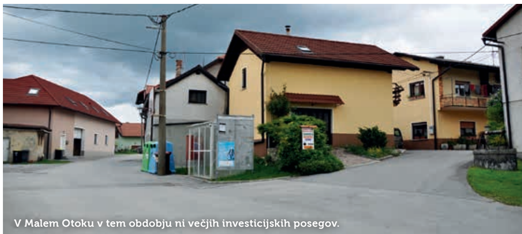
V Malem Otoku v tem obdobju ni večjih investicijskih posegov.