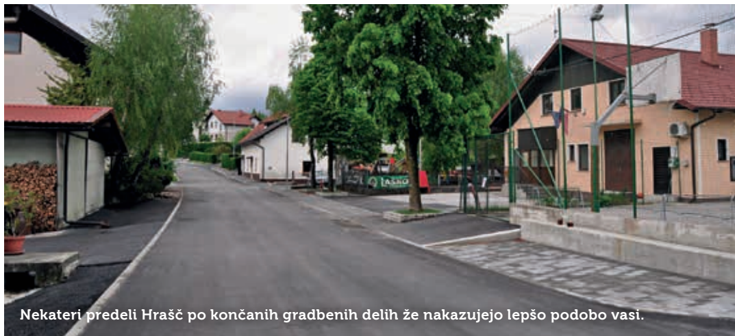
Nekateri predeli Hrašč po končanih gradbenih delih že nakazujejo lepšo podobo vasi.

Predlogov in želja je veliko več, kot jih lahko prenese proračun KS. Zato skušajo v svetu KS iskati ravnotežje med pobudami krajanov in možnostmi uresničevanja projektov. Vsi izvedbeni predlogi pa se uvrščajo pod eno izmed treh glavnih