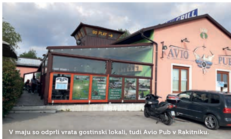
V maju so odprli vrata gostinski lokali, tudi Avio Pub v Rakitniku.

Konec aprila je bilo prijavljenih na zavodu 879 brezposelnih iz postojnske in pivške občine, skoraj 23 odstotkov več kot aprila lani.