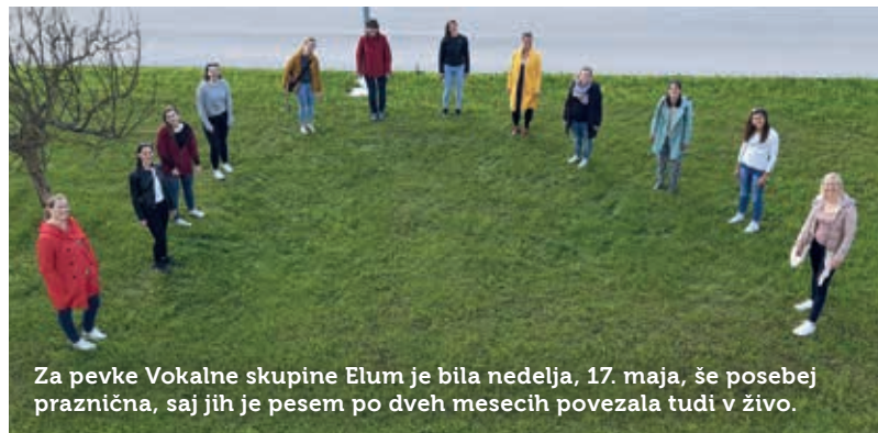
Za pevke Vokalne skupine Elum je bila nedelja, 17. maja, še posebej praznična, saj jih je pesem po dveh mesecih povezala tudi v živo.

Najprej so svoji članici, »novo pečeni mami«, zapele pred postojnsko porodnišnico, nato pa še na Titovem trgu. Dogodka niso posebej najavile, saj do zadnjega trenutka ni bilo jasno, kje in če sploh bodo lahko zapele. Nedeljsko popoldne so tako polepšale peščici prijetno presenečenih mimoidočih. Ob upoštevanju varnostne razdalje so se pomudili na »prizorišču« in prisluhnili veselim melodijam ob kitarski spremljavi. S podoknico so