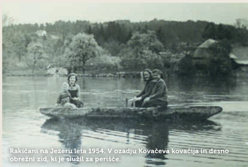
Rakičani na Jezeru leta 1954. V ozadju Kovačeva kovačija in desno obrežni zid, ki je služil za perišče.

kaj mesecev na leto – največ v jeseni in spomladi, redkokdaj tudi pozimi, ko zamrzne. Domača hiša je oddaljena od potoka oziroma Jezera le nekaj metrov. Ob njegovi polni strugi ali ob polnem Jezeru sta imeli mama in sestra na bregu zelo priročno perišče. Druge Rakičanke pa so takrat prale na obrežnem zidu ob Kovačevi kovačiji, in ko se je voda umaknila, pod njim. Del leta je bila v strugi potoka ob vasi le Luža za napajanje živine. Takrat so nekatere perice splakovale pri Stari štirni na Svinjariji, druge pa pri studencu na Čelharjevem vrtu (novi lastnik ga je pred nekaj leti zasul). Hudo je bilo, ko sta tudi ta vira usahnila. Tisti, ki so imeli rezervoar (takih je bilo le nekaj), so izkoriščali kapnico ali pa so vodo vozili domov iz Nove štirne v ročnih vozičkih ali z živino iz nekaj sto metrov oddaljenega Maticovega studenca.